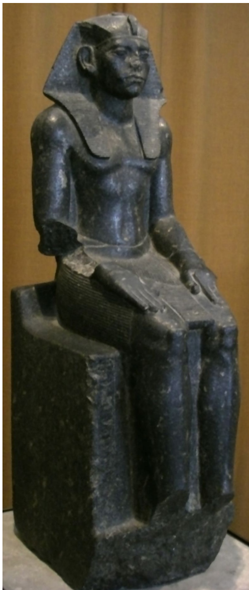
de uma estátua de Amenemhat III