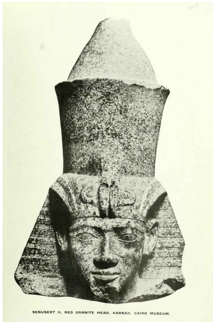
Cabeça de uma estátua de Senusret II de Karnak