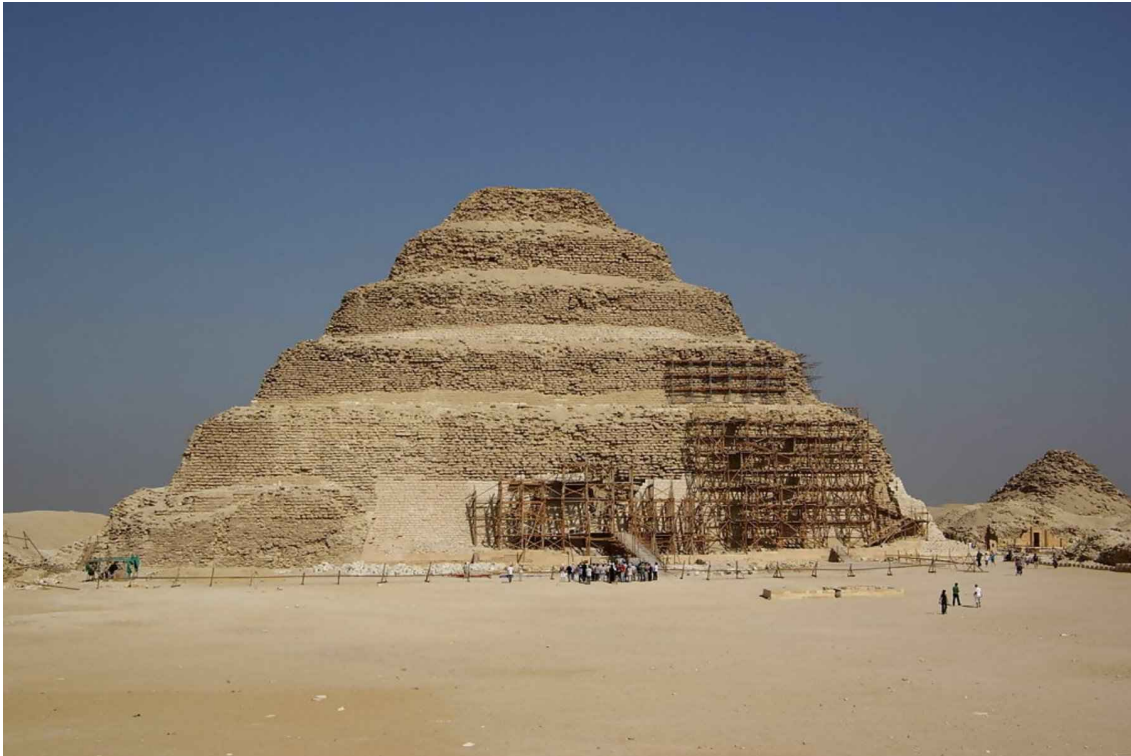
A imagem de Berthold Weiner da Pirâmide de Djoser