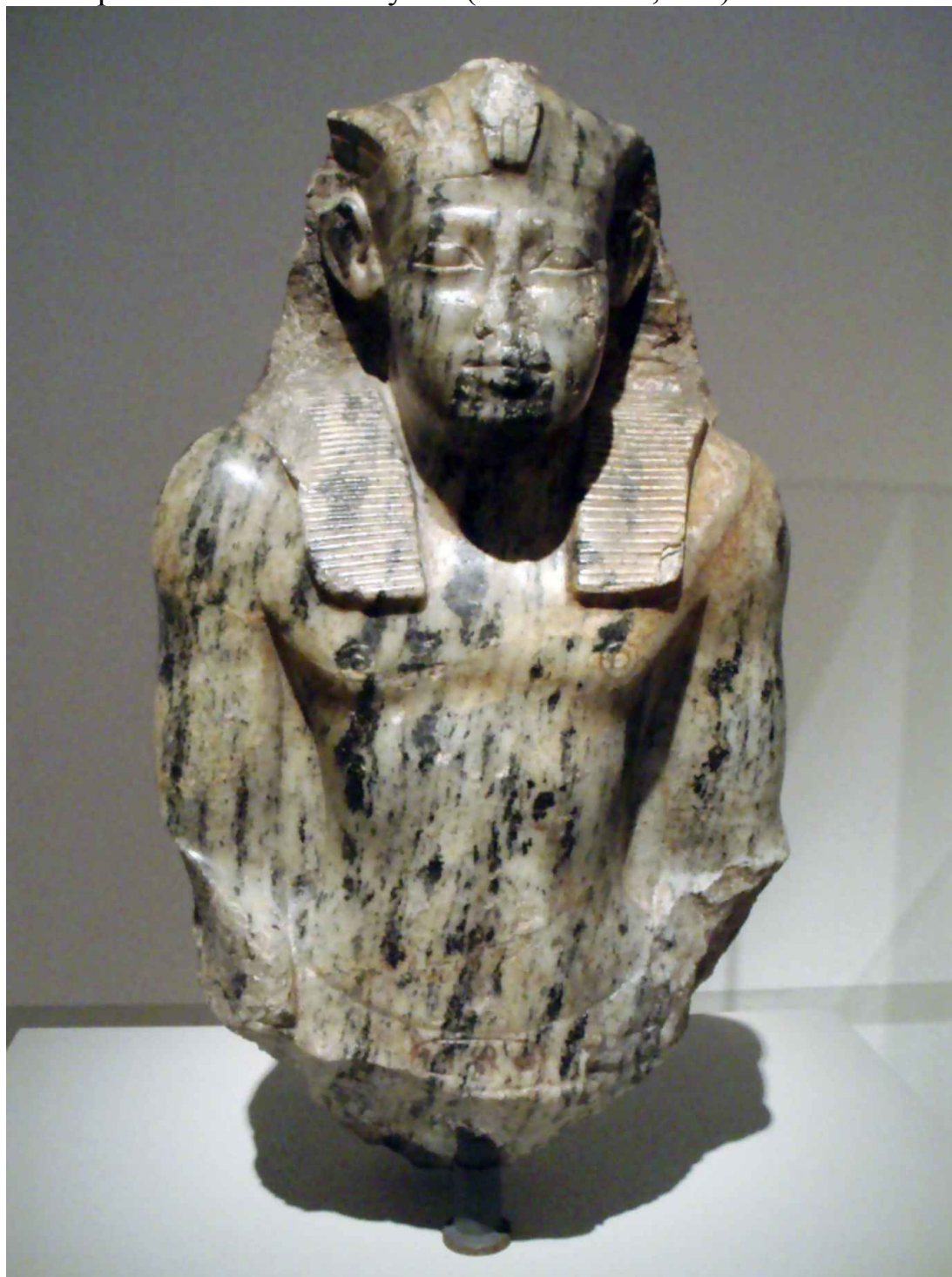
Busto de Senusret I no Neues Museum, Berlim

a uma princesa chamada Itaytket (Lehner 2001, 173).