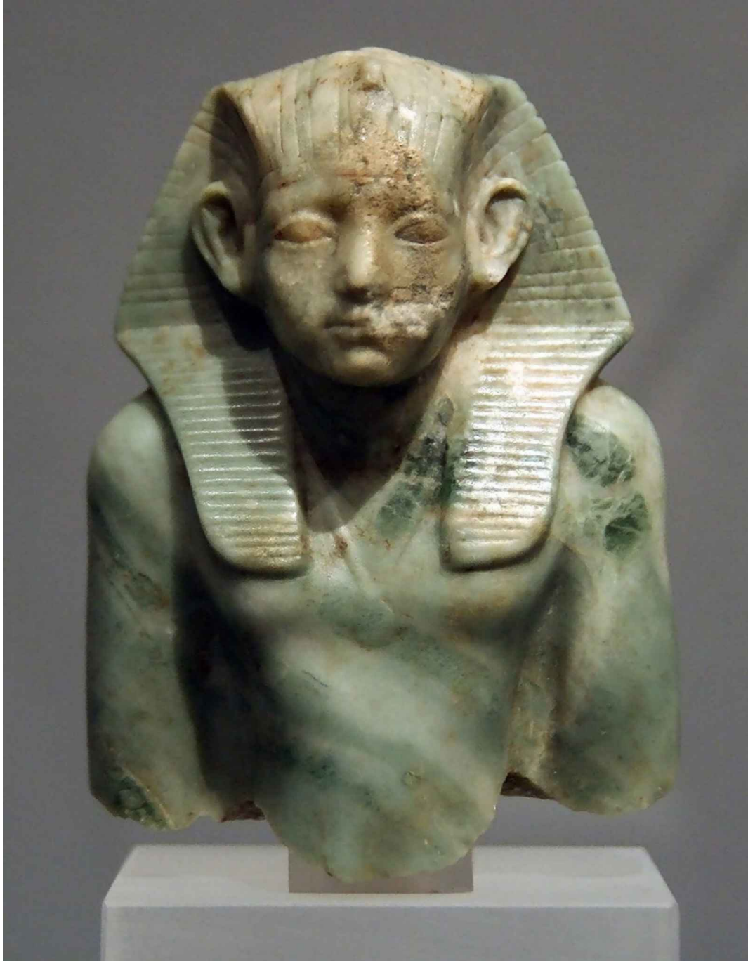
A foto de Manfred Werner de um busto de Amenemhat III