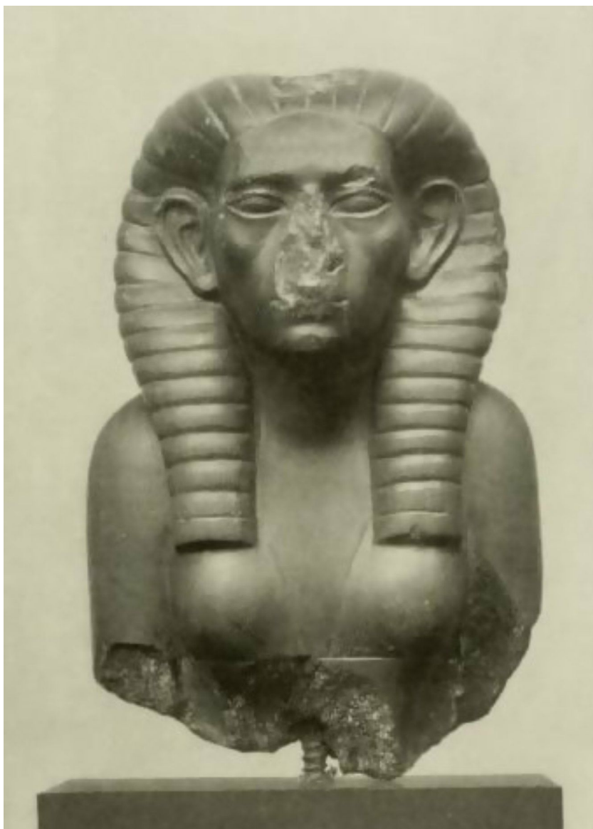
Busto de Sobekneferu