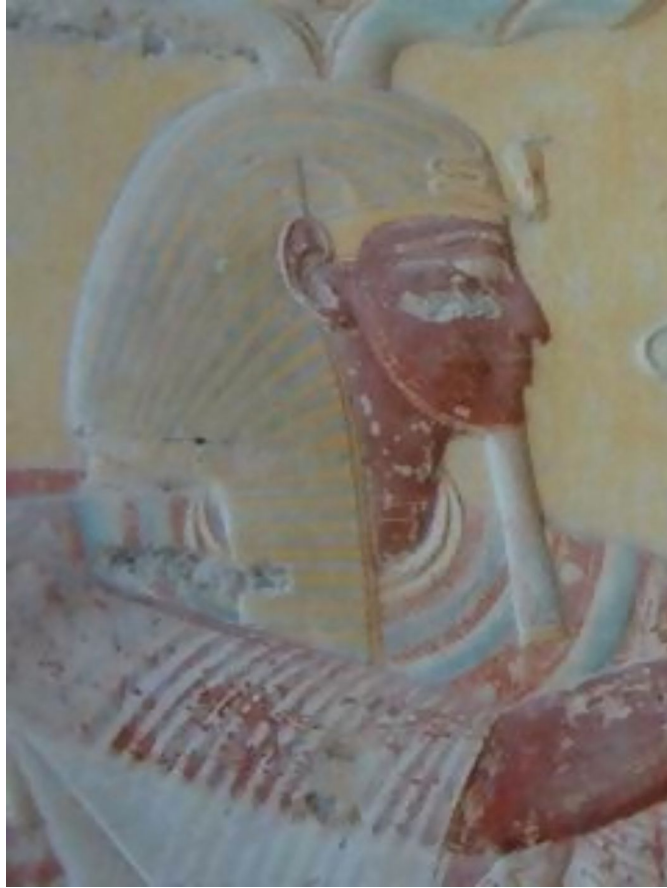
Um perfil lateral representando os nemes