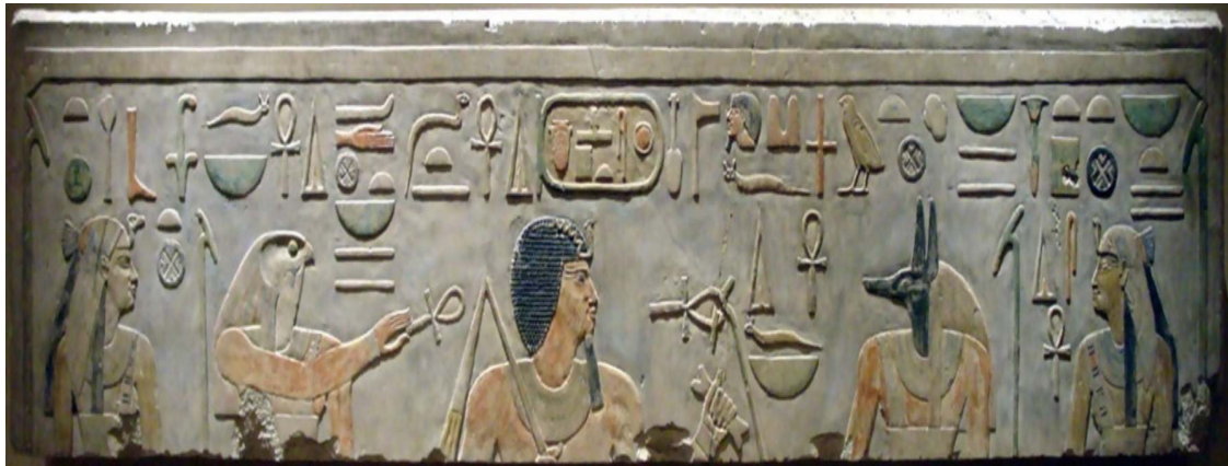
Um relevo representando Amenemhat I de seu templo funerário

O vizir mencionado no texto, Amenemhat, acredita-se ser Amenemhat I da Décima Segunda Dinastia, que provou ser um dos faraós mais ambiciosos e trágicos do Egito.