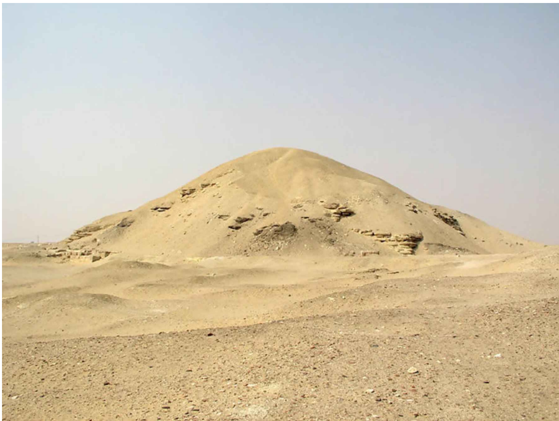
das ruínas da pirâmide de Userkaf