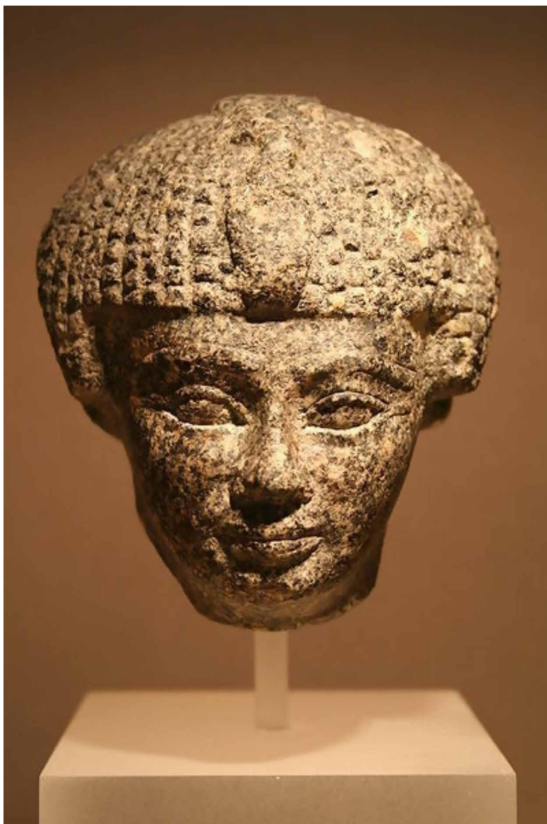
Foto de um busto de Senusret I