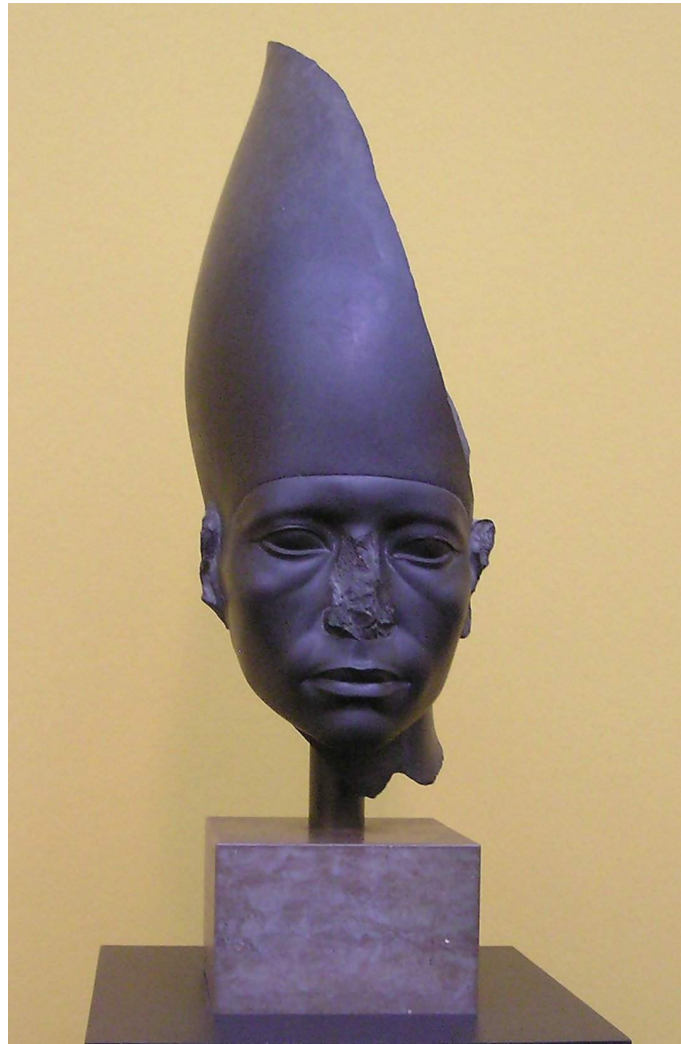
Um busto de Amenemhat III

construído numa orientação leste-oeste, mais indicativo de complexos pirâmides do Antigo Reino da Terceira Dinastia (Lehner 2001, 179 ).Como as outras pirâmides do Reino Médio, a pirâmide de Dashur, de Amenemhat III, agora nada mais é do que um monte de entulho, que é o resultado da pirâmide sendo construída perto de um lago tanto quanto de um acabamento inferior (Lehner 2001, 178).