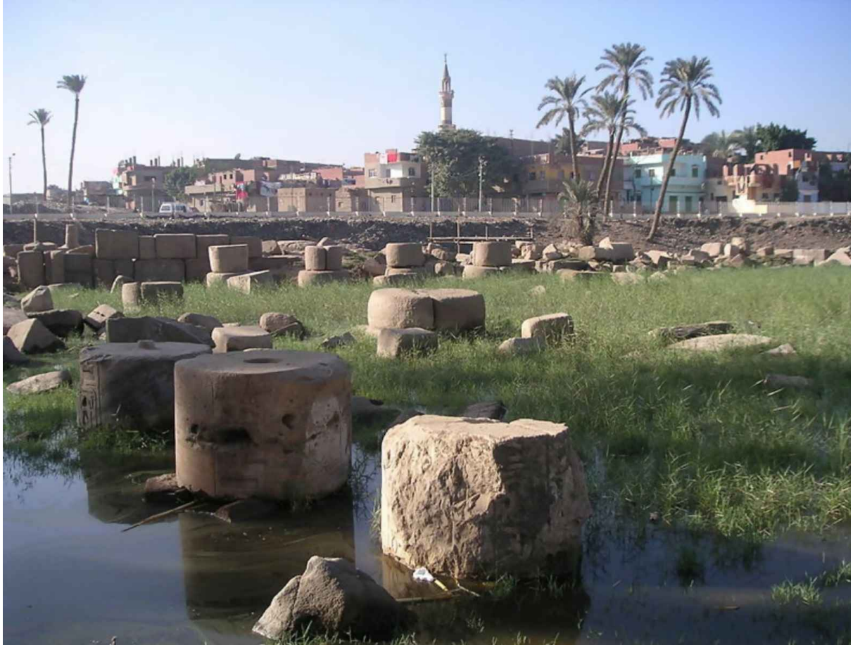
Foto das ruínas do salão de Ramesses o Grande em Memphis