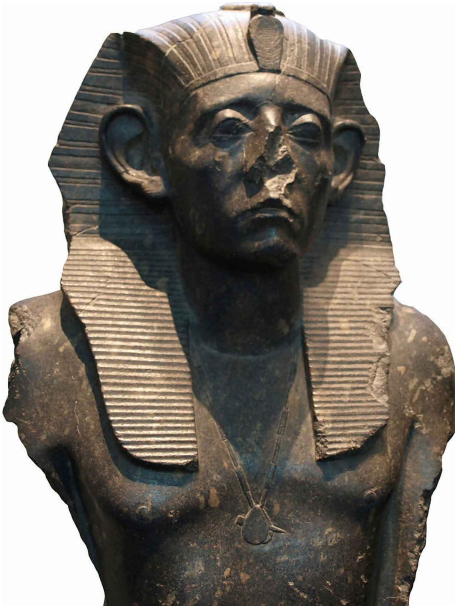
Imagem de estátuas de Senusret III

Como mencionado acima, as façanhas de Senusret III foram romantizadas e combinadas com as de outros reis egípcios para criar uma imagem positiva do rei que ainda era comum no Egito quase 2.000 anos depois de seu governo. Diodorus baseou sua história do Egito em uma combinação de fontes, embora os primeiros escritores gregos e sacerdotes egípcios que ele conferiu pessoalmente pareçam ter composto a maior parte de suas fontes primárias (Krebsbach 2014, 100). A natureza benéfica do rei sobre a qual ele escreveu foi, portanto, largamente extraída das histórias orais dos sacerdotes