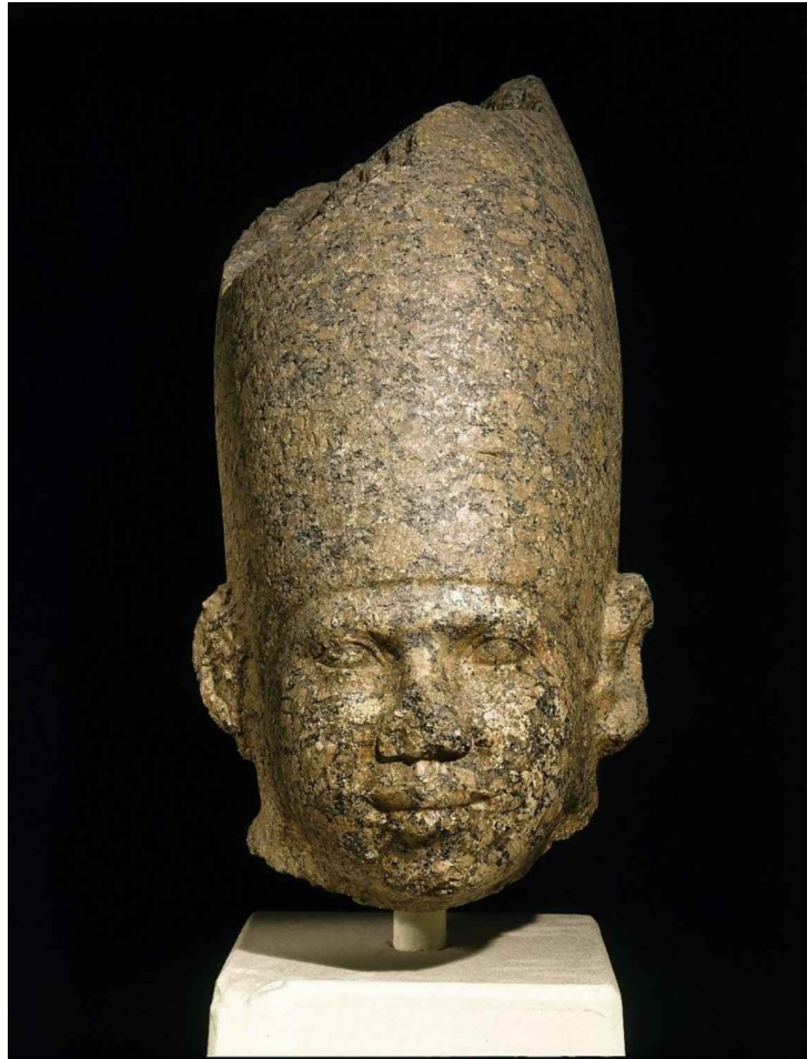
Um busto de um rei do Egito

A África pode ter dado origem aos primeiros seres humanos, e o Egito provavelmente deu origem às primeiras grandes civilizações, que continuam a fascinar as sociedades modernas em todo o mundo quase 5.000 anos depois. Da Biblioteca e Farol de Alexandria à Grande Pirâmide de Gizé, os antigos egípcios produziram várias maravilhas do mundo, revolucionaram a arquitetura e a construção, criaram alguns dos primeiros sistemas de matemática e medicina do mundo e estabeleceram a linguagem e a arte que se espalham pelo mundo. mundo conhecido. Com líderes mundialmente famosos como o rei Tut e Cleópatra, não é de admirar que o mundo de hoje tenha tantos egiptólogos.