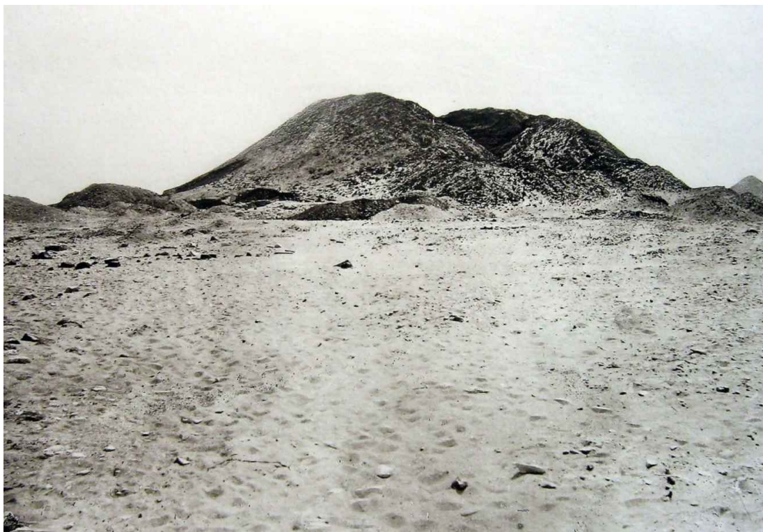
Foto da pirâmide de Senusret III do século 19

pirâmide em Dashur, Senusret III também tinha um túmulo construído na cidade sagrada de Abydos (discutido mais abaixo).